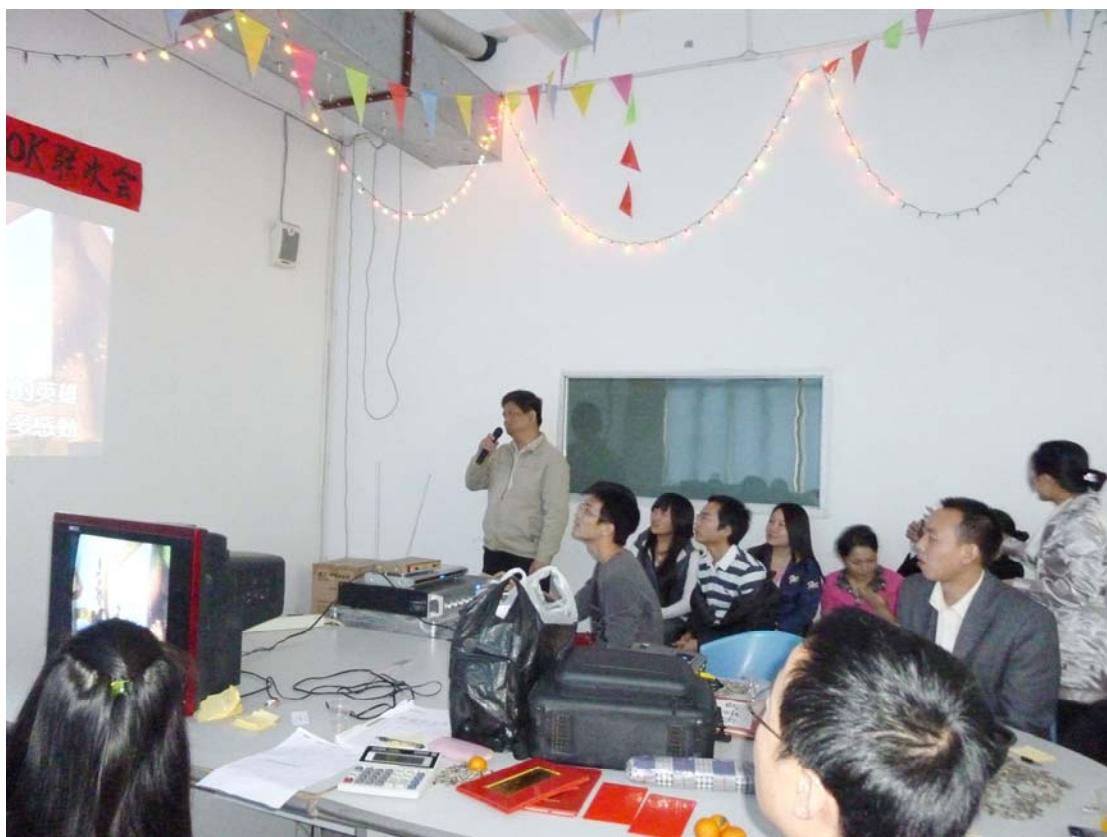
▲彭经理在联欢会上与员工同乐