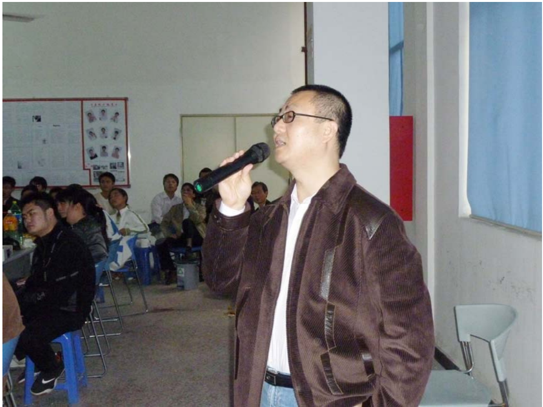
▲集团行政部贺经理在联欢会上高歌一曲