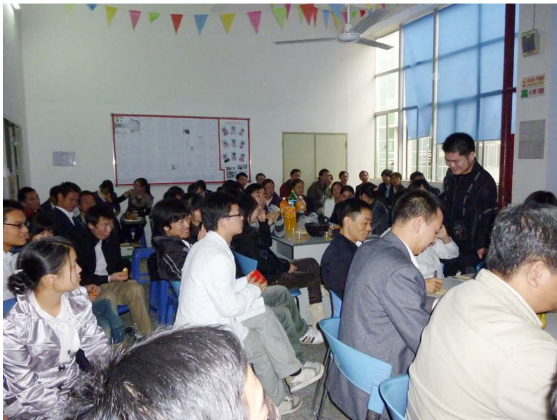
▲确能公司 2010年元旦联欢会现场