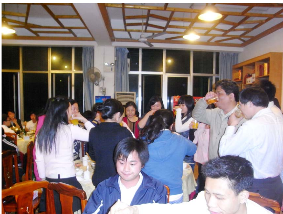
▲ 彭经理、集团财务部丁经理与员工举杯同庆2010元旦